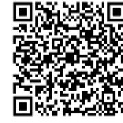
扫描二维码 看全文报道