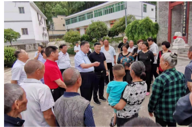
本文来源《高洛日报》

桑梓情，积极支持山阳县开展集体补助和社会资助城乡居民养老保险试点工作，于今年8月首批捐资50万元，建立了“漫川关镇南坡村养老保险资助专项基金”，开创了山阳县企业家捐资以集体补助形式资助困难村民缴纳养老保险的先河，由山阳县建立全覆盖、保基本、多层次、可持续的社会保障体系，促进县域经济社会高质量发展作出了积极贡献。