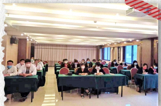
山阳鸿瑞餐饮服务有限公司