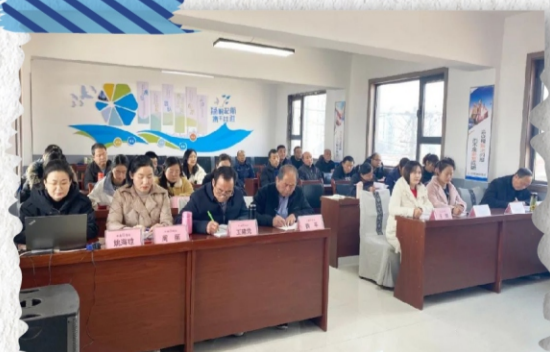
陕西轩轅圣地酒业有限公司