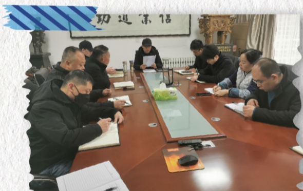
商洛市商州区瑞元小额贷款有限责任公司