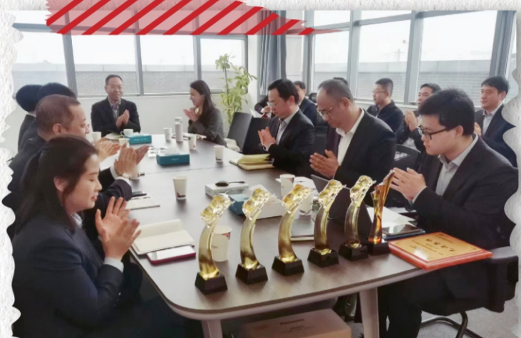
商洛鸿瑞怡园置业有限公司