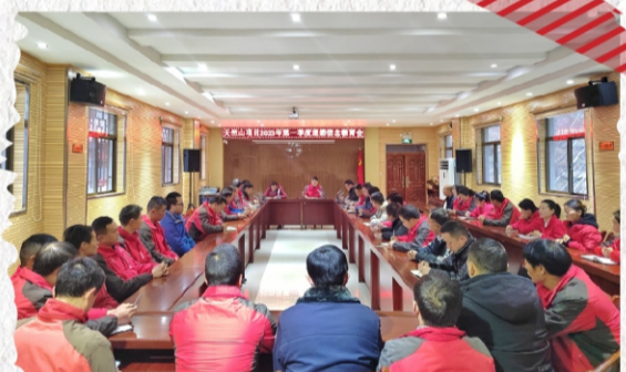
陕西鸿瑞旅游发展有限公司