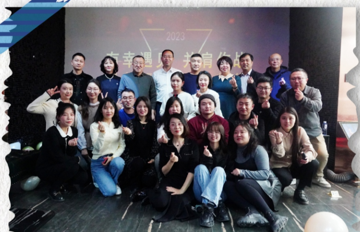
西安鸿瑞达投资管理有限公司