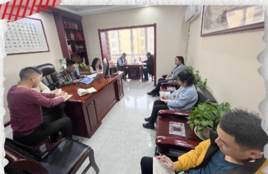
陕西轩轅投资有限公司